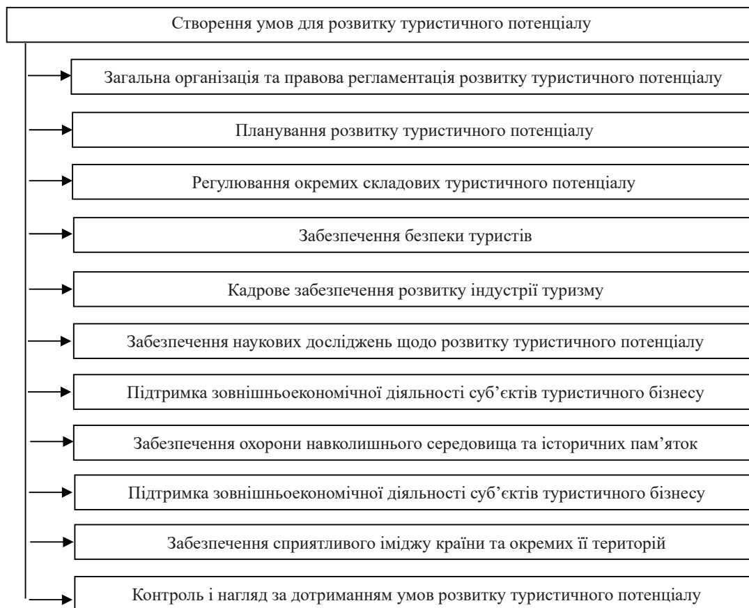
Рис. 1. Функції державного регулювання розвитку туристичного потенціалу