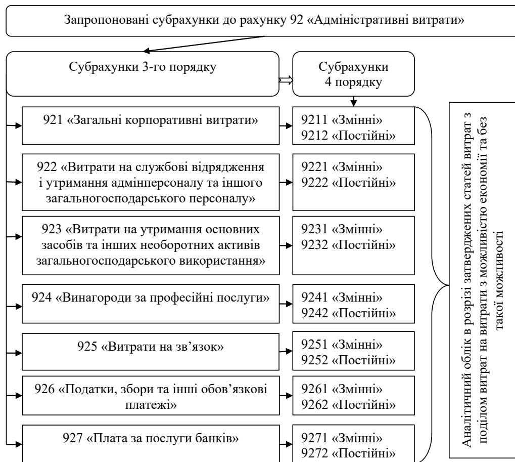
Рис. 2. Запропонована структура рахунку 92 «Адміністративні витрати»

При цьому, необхідно врахувати, що окремі статті адміністративних витрат можуть включати змішані витрати, тобто витрати які містять і постійну і змінну частину. Такі статті витрат рекомендуємо відображати частинами на двох рахунках четвертого порядку. В частині змінних витрат – на субрахунку «Змінні адміністративні витрати», а в частині постійних витрат – на субрахунку «Постійні адміністративні витрати».