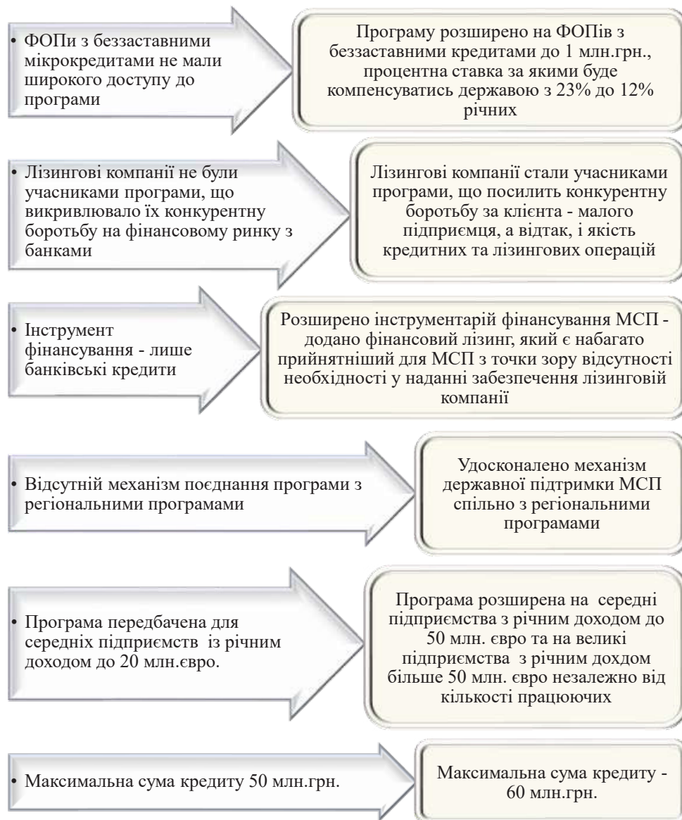
Рис. 1. Основні зміни до програми "Доступні кредити 5-7-9%".