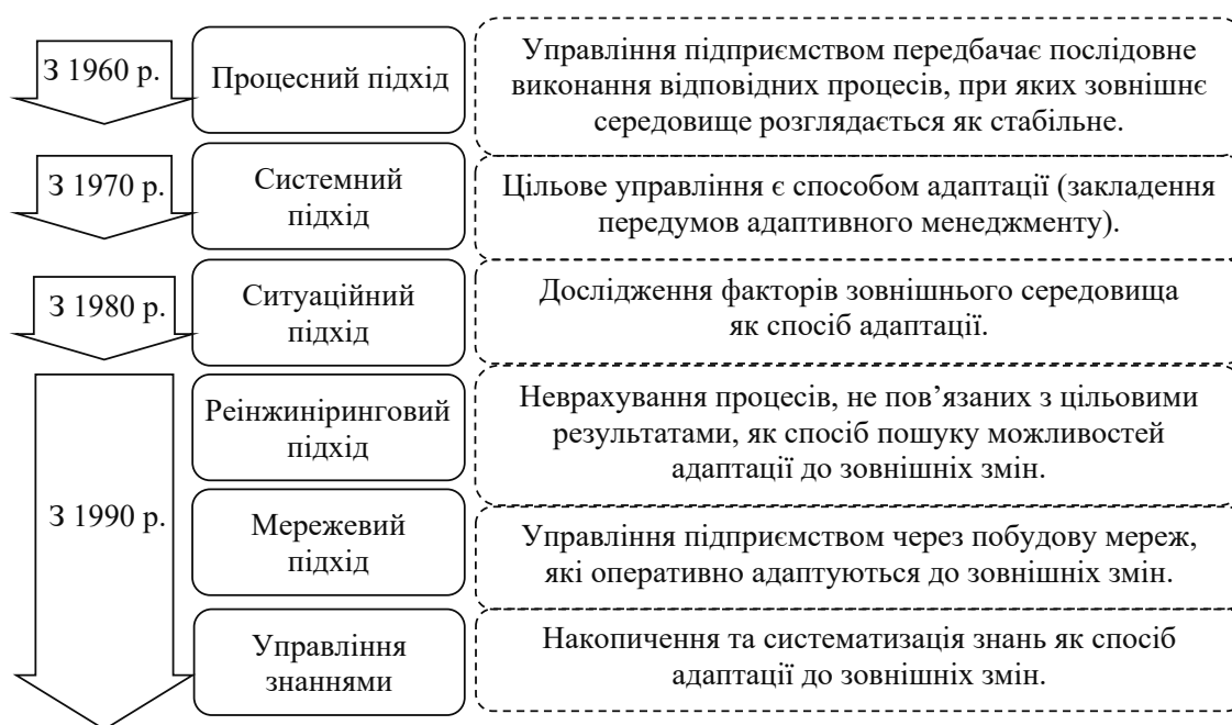
Рис. 2. Способи адаптації підприємства до змін зовнішнього середовища, які використовуються у сучасних підходах до управління підприємством