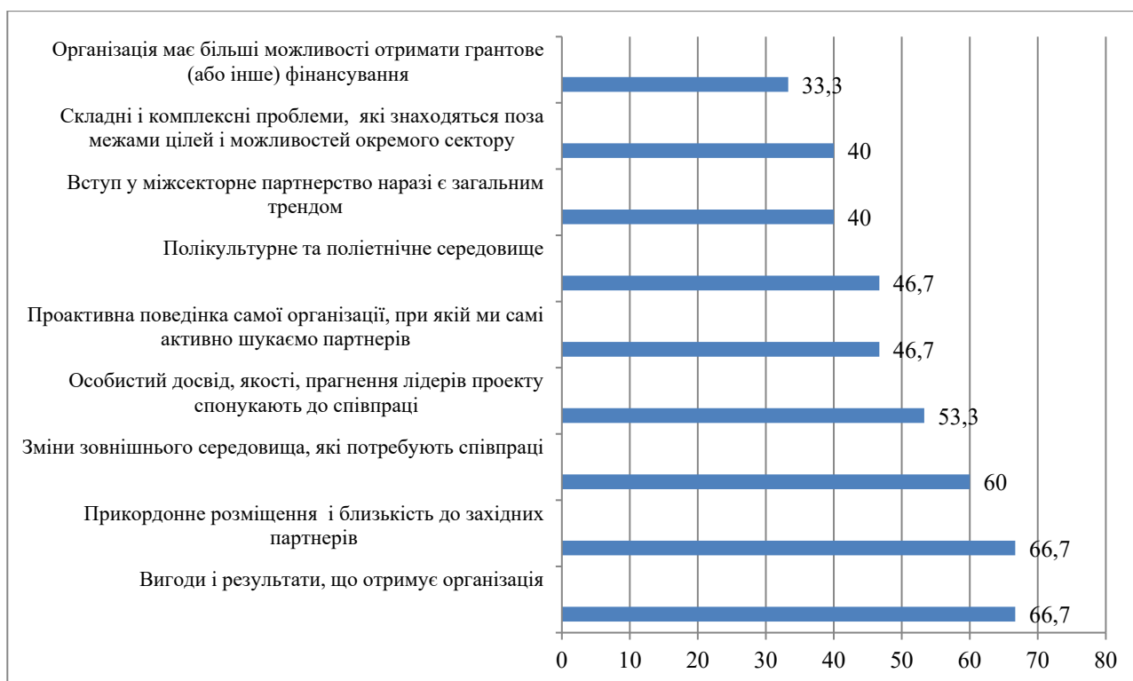
Рис. 2. Рівень важливості причини міжсекторної співпраці бізнесу, %