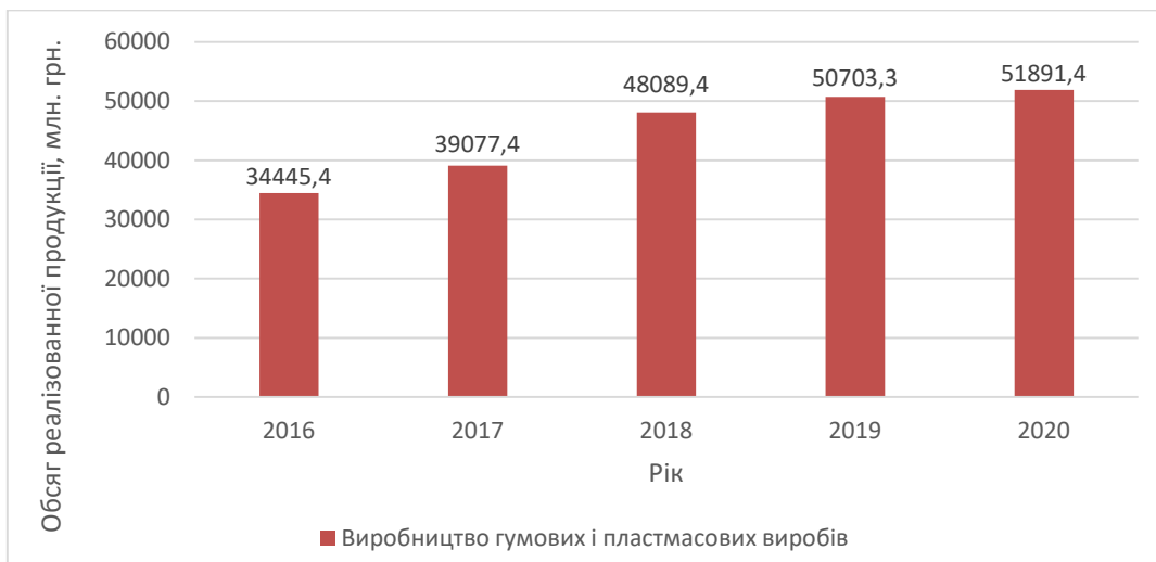
Рис. 1. Обсяги реалізованих пластмасових виробів за 2016–2020 рр.