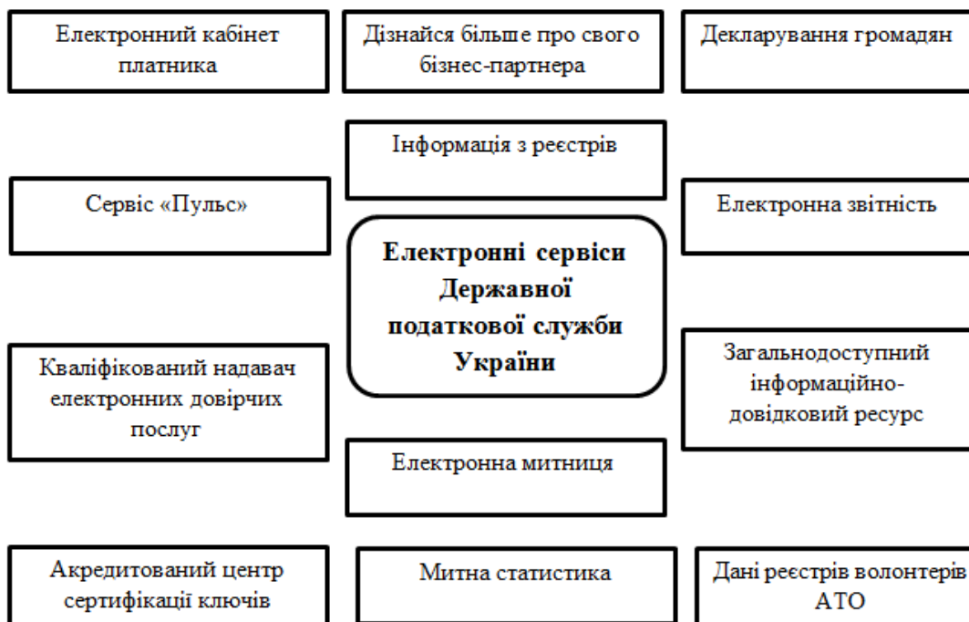
Рис. 2. Електронні сервіси ДПС

Механізм електронного адміністрування податку на додану вартість викладено у Постанові КМУ від 16 жовтня 2014 року № 569, який запроваджено 1 лютого 2015 року [6]. Сьогодні