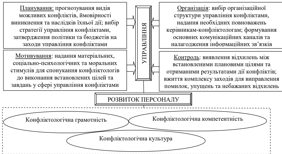
Рис. 2. Логіка виконання функцій управління конфліктами у контексті компетентнісного підходу до розвитку персоналу промислового підприємства

Джерело: сформовано автором на основі [4]