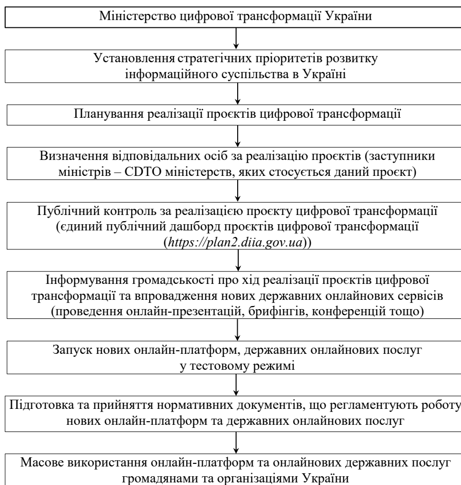
Рис. 2. Етапи реалізації проєктів цифрової трансформації урядом України