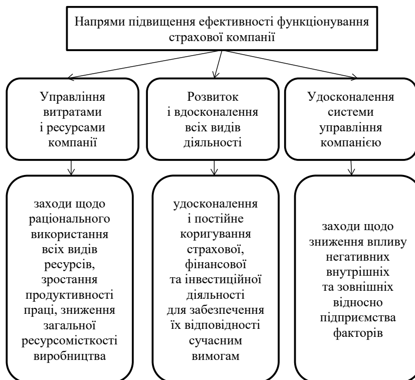
Рис. 2. Напрями та заходи з підвищення ефективності діяльності страхової компанії

коштів у розвиток компанії та створення нових страхових продуктів тощо. Сьогодні основними напрямками інвестування страхових компаній є банківські депозити та цінні папери. Суттєвими проблемами здійснення інвестиційної діяльності страховиків є нерозвиненість фондового ринку в Україні, законодавчі обмеження щодо інвестування, відсутність довгострокових фінансових інструментів [5, с. 82].