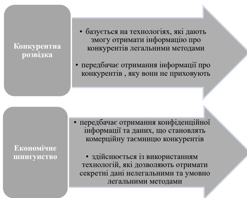
Рис. 3. Особливості конкурентної розвідки та економічного шпигунства

Висновки. За ринкової форми господарювання дуже важко забезпечити баланс фінансових інтересів між конкуруючими підприємствами. Однак, створення дієвої системи регулювання конкурентних відносин з ефективним співвід-