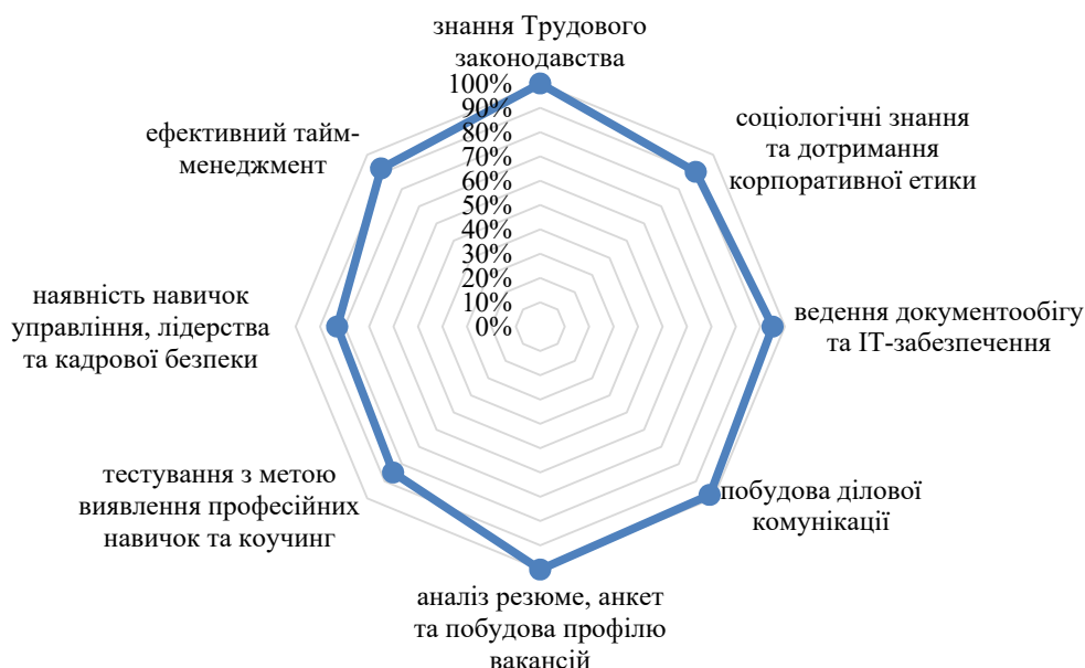
Рис. 3. Компетенції, якими повинні володіти представники професії «менеджер із персоналу»

Наведені моделі компетенцій відрізняються тим, що вони націлені на різні рівні працівників. Наприклад, модель DDA орієнтована на менеджерів та вище керівництво підприємства; модель ІМС – на професіоналів та середній менеджмент; модель WSC – на працівників робітничих спеціальностей [11].