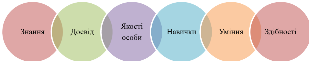
Рис. 1. Основні складники компетенції працівників