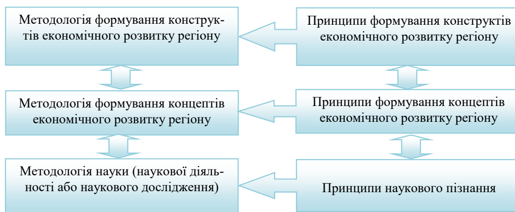
Рис. 1. Методологічні принципи формування концептів і конструктів економічного розвитку регіону [2]

Формування концепції економічного розвитку регіону можливе завдяки застосуванню відповідного комплексу методів, який ґрунтується на системній парадигмі наукового пізнання й економічній теорії та теорії регіоналістики. Із іншого боку, виходячи з об'єкта дослідження, не менш важливим є ґрунтування методів на теоріях економічного розвитку, що дають змогу системно досліджувати основні чинники економічного розвитку регіонів. У цій роботі