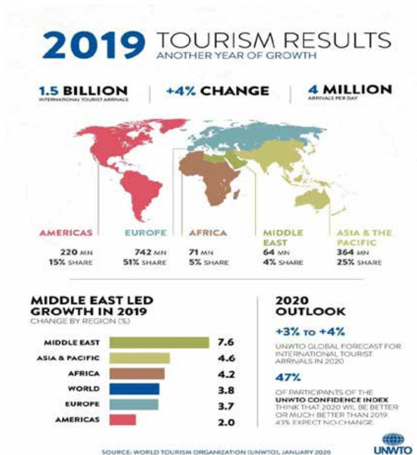
Рис. 1. Тенденції розвитку міжнародного туризму в 2019 р. [1, с. 1]