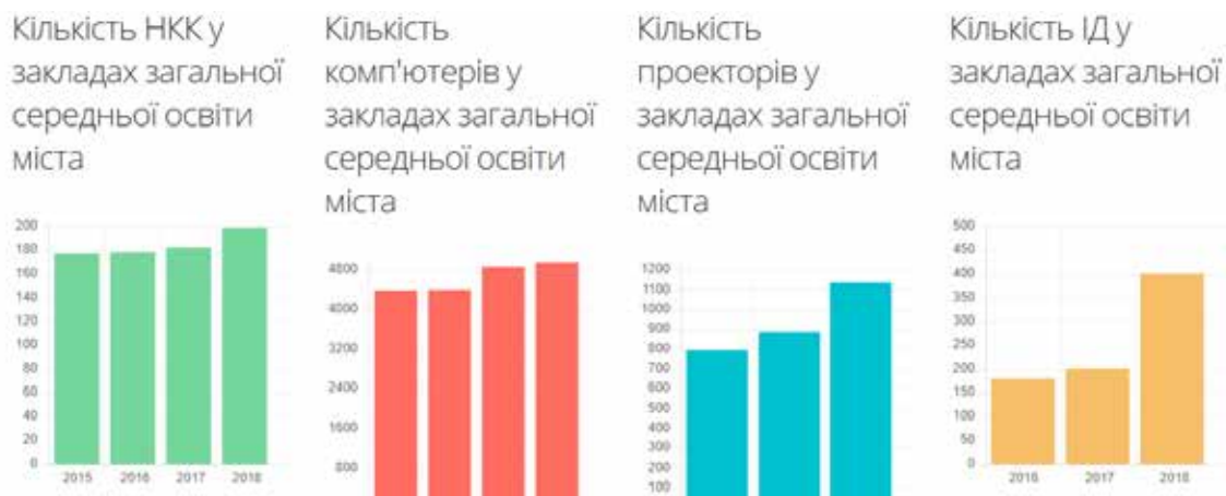
Рис. 4. Забезпечення закладів та установ освіти комп'ютерною та мультимедійною технікою в м. Одеса