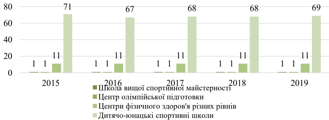
Рис. 1. Кількість дитячо-юнацьких спортивних шкіл та спеціалізованих дитячо-юнацьких шкіл олімпійського резерву в Одеській області за 2015–2019 рр. (шт.)