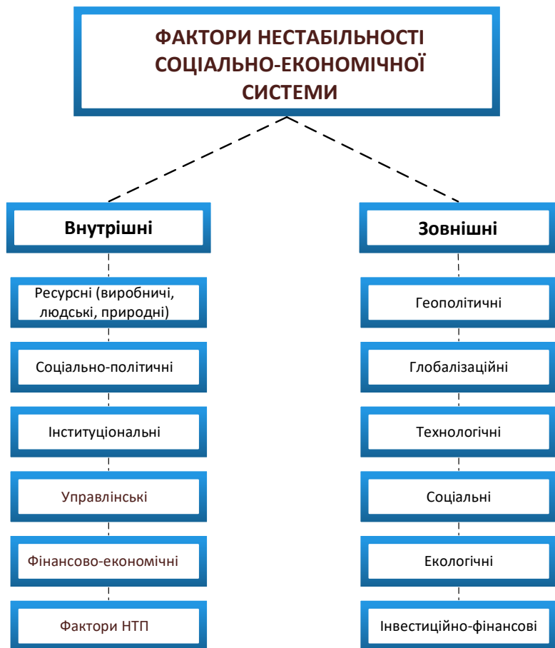
Рис. 3. Класифікація факторів нестабільності соціально-економічної системи