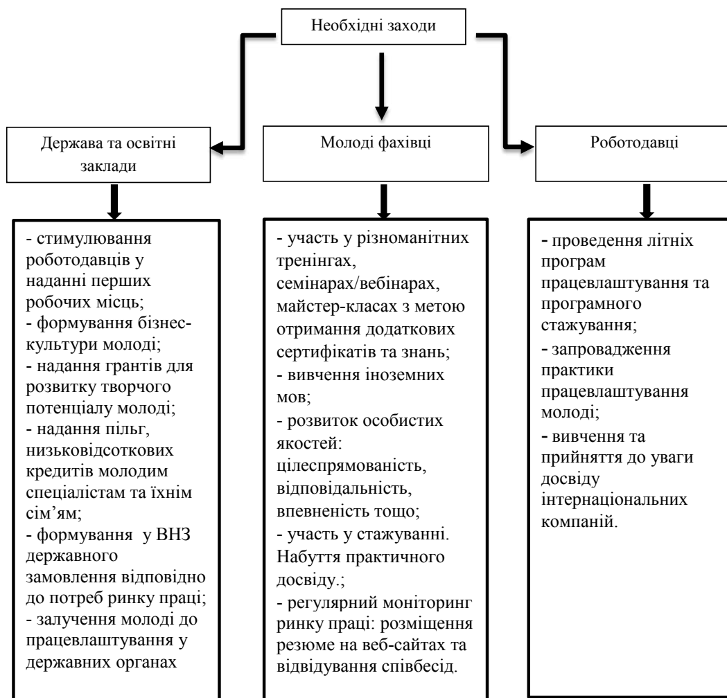
Рис. 3. Шляхи подолання молодіжного безробіття залежно від зацікавлених сторін