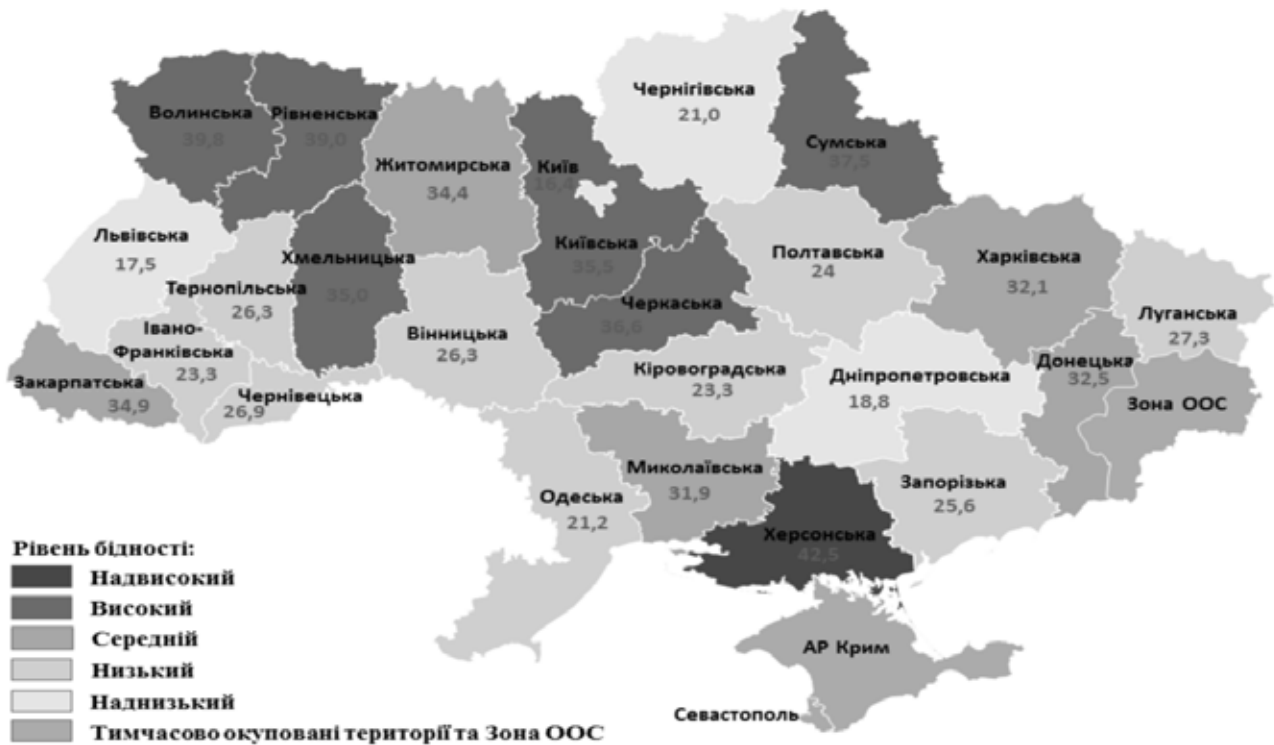
Рис. 2. Рівень бідності за абсолютним критерієм за доходами нижче фактичного прожиткового мінімуму у 2017 році за територіальними ознаками [7]

окремого регіону України, так і на загальнодержавному рівні.