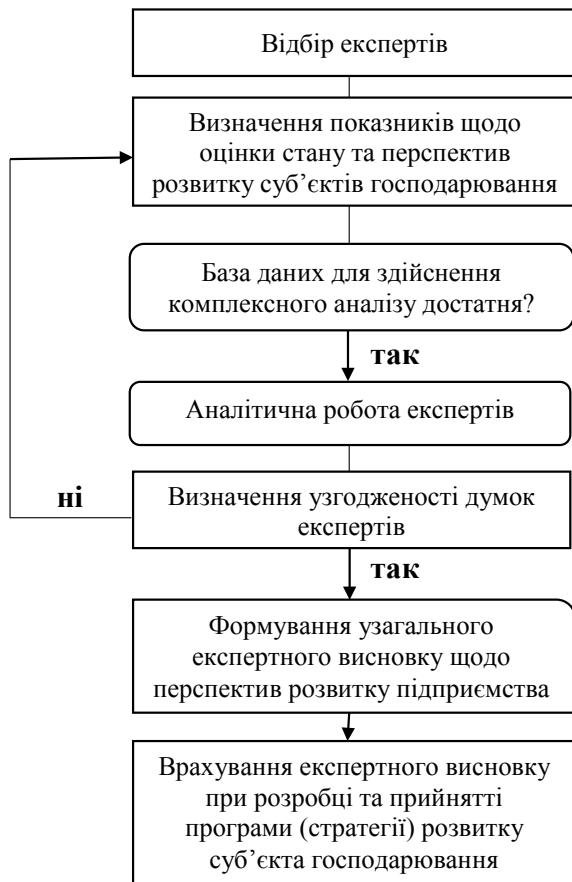
Рис. 2. Алгоритм експертної оцінки щодо розвитку суб'єкта господарювання