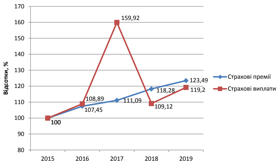
Рис. 2. Динаміка росту страхових виплат і премій за 2015–2019 роки, %

Рівень страхових премій, вищий за рівень виплат, свідчить про укріплення страхового ринку. Матричний аналіз дає змогу подивитися на страхову сферу з усіх сторін, як позитивних, так і негативних.