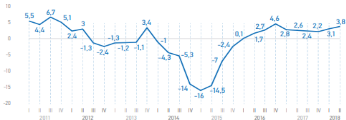
Рис 1. Зміна обсягу ВВП, у % до відповідного кварталу попереднього року