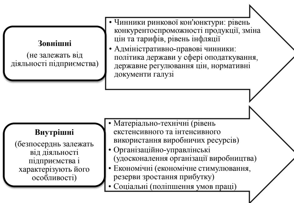
Рис. 2. Чинники, що впливають на величину рентабельності

ність капіталу – це той показник, який має тенденцію до вирівнювання в масштабах усієї економіки, тобто низьке значення цього показника протягом тривалого часу може розглядатися як непряма ознака спотворення звітності; • зростання рентабельності інвестованого капіталу відображає збільшення здатності бізнесу створювати вартість, тобто підвищувати добробут власників; рентабельність інвестованого капіталу повинна перевищувати середньозважену ціну капіталу підприємства, розраховану з урахуванням ринкових цін на джерела фінансових ресурсів.