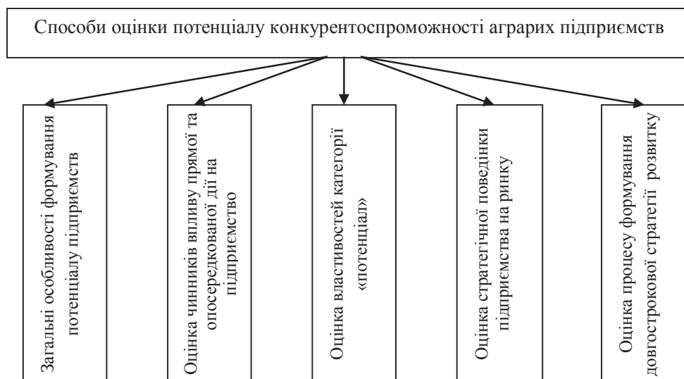
Рис. 2. Альтернативні варіанти оцінки потенціалу конкурентоспроможності аграрних підприємств

На нашу думку, найбільш відповідними сутності категорії «потенціал» будуть такі способи його оцінки (рис. 2):