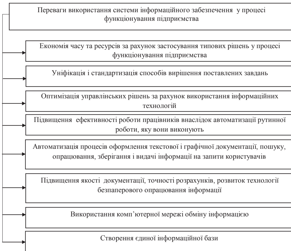
Рис. 1. Переваги використання системи інформаційного забезпечення у процесі функціонування підприємства