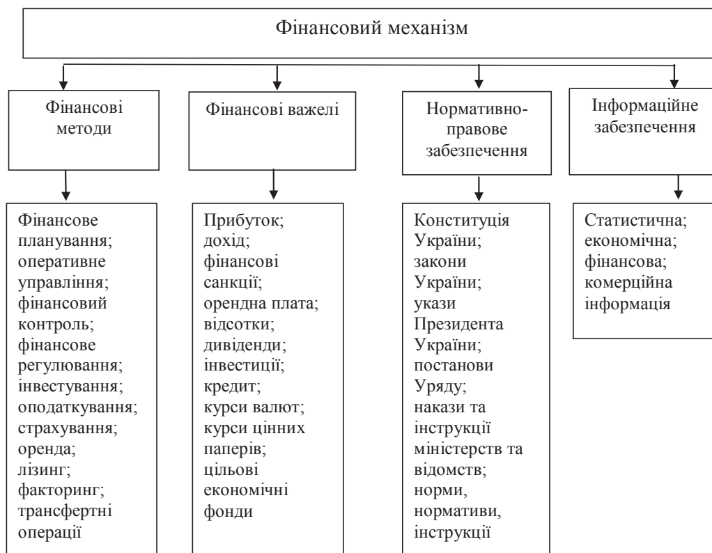
Рис. 1. Основні елементи фінансового механізму

Спільним для кожного етапу розроблення механізму управління фінансовою стійкістю є використання відповідних інструментів, тому під час розроблення схеми механізму управління доцільно визначити для кожного етапу процесу управління конкретний інструментарій, який може бути використано в майбутньому.