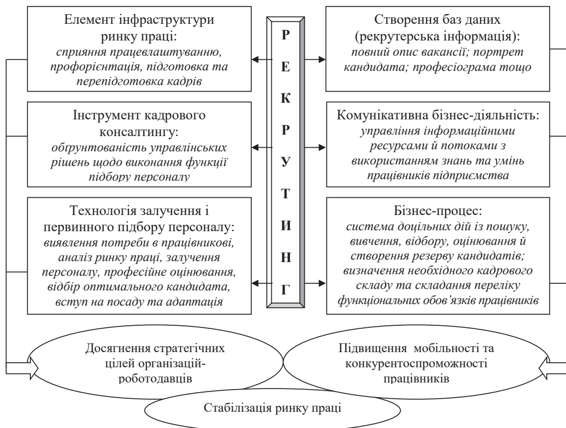
Рис. 1. Основні підходи до тлумачення змісту поняття «рекрутинг»

З іншого боку, рекрутинг – це розроблення процедури залучення і первинного підбору персоналу. Елементами рекрутингу є виявлення потреби в працівникові, аналіз ринку праці, залучення персоналу, відсіювання за допомогою співбесід, професійне оцінювання за допомогою психологічних методів, відбір оптимального кандидата, процес вступу на посаду й адаптація [12, с. 83–84; 16, с. 110; 17, с. 132].