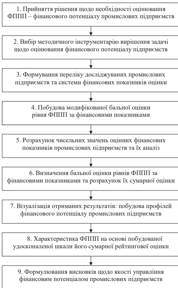
Рис. 2. Схема реалізації покрокового алгоритму рейтингового оцінювання фінансового потенціалу промислових підприємств

Узагальнення проведених досліджень щодо теоретично-методичних підходів до оцінювання різноманітних видових проявів потенціалу підприємств дало змогу розробити покроковий алгоритм оцінювання фінансового потенціалу промислових підприємств (скорочено ФППП), схему реалізації якого представлено на авторському рис. 2.