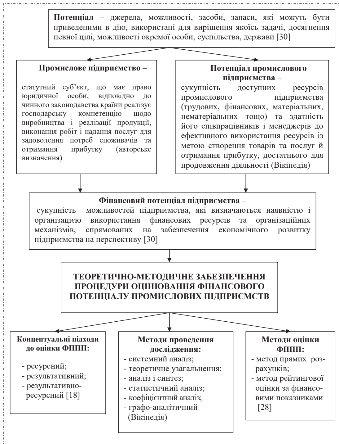
Рис. 1. Теоретична платформа дослідження

алу промислових підприємств; методичні підходи до розрахунку системи показників; аналіз отриманих результатів і надання певних рекомендацій з їх узагальнення; форми представлення отриманих результатів (таблична, графічна) для прийняття відповідних рішень у сфері фінансового менеджменту промислових підприємств. Відповідно до встановленої мети, розроблено теоретичну платформу дослідження (рис. 1), яка відображає сукупність взаємозв'язаних основних елементів, що фор-