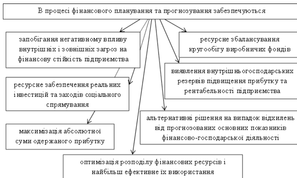
Рис. 2. Наслідки за ефективного застосування фінансового планування та прогнозування