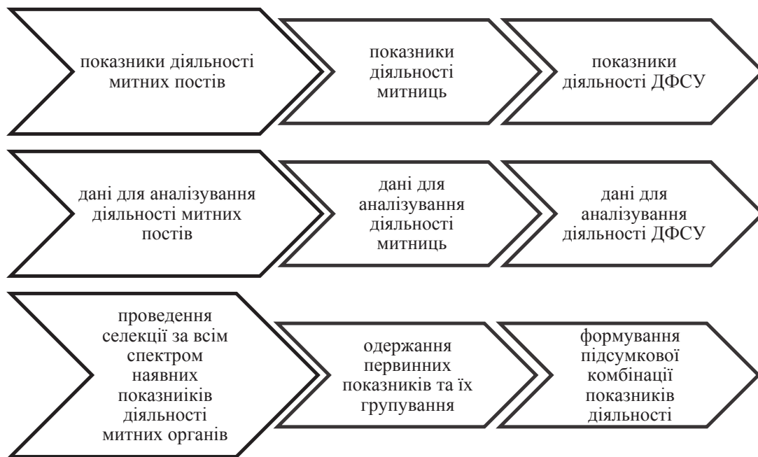
Рис. 2. Єдиний алгоритм формування набору показників митної діяльності

Ці вимоги стосуються як кількісних, так і якісних показників. Як правило, під час постановки якісних показників органами влади видаються інструкції, в яких чітко визначаються критерії якісної діяльності.