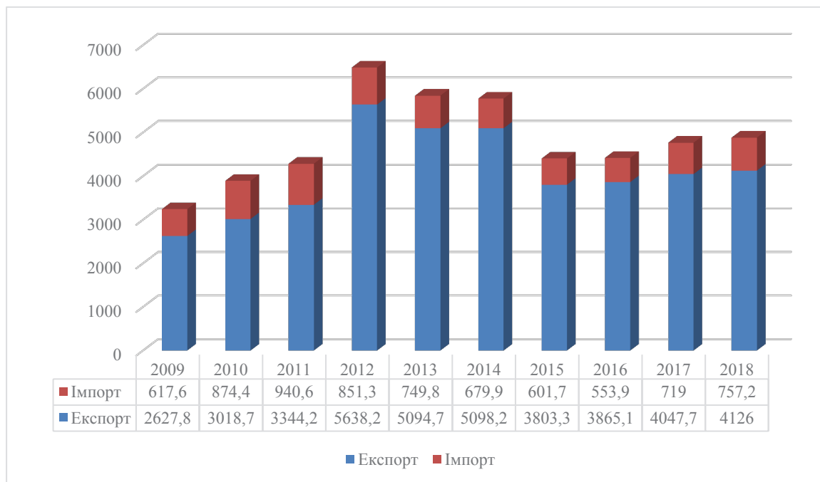
Рис. 2. Динаміка зовнішньої торгівлі України з країнами Африки в 2009–2018 рр. (млн дол. США)