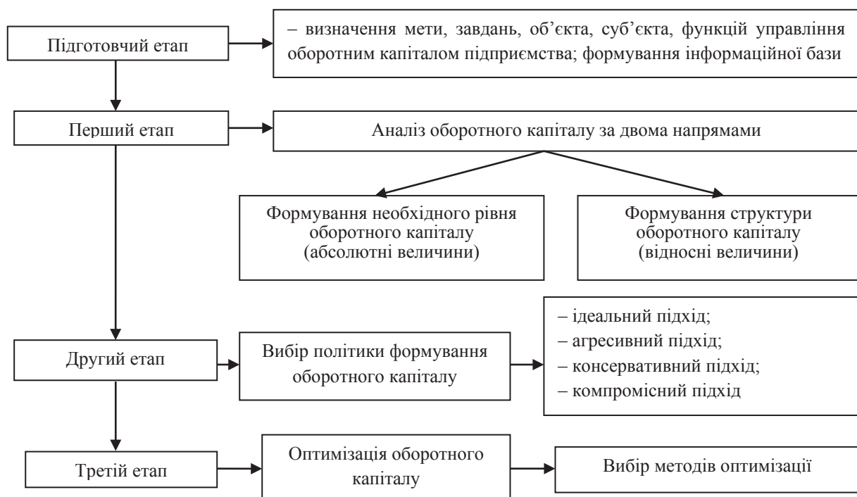
Рис. 2. Організація управління оборотним капіталом підприємства

Важливими результатами управління оборотним капіталом є: комплексне використання сировини та матеріалів; зростання обсягів виробництва продукції; зменшення дебіторської заборгованості; підвищення оборотності оборотного капіталу; зменшення тривалості одного обороту; істотне скорочення кількості непотрібних робіт; надання діяльності підприємств цілеспрямованості; формування системи мотивації роботи персоналу; забезпечення ефективності, а саме прибутковості підприємства у цілому, тощо. Як уже зазначалося, кожне підприємство має певні особливості та власний процес розвитку, тому під час формування системи управління оборотним капіталом необ-