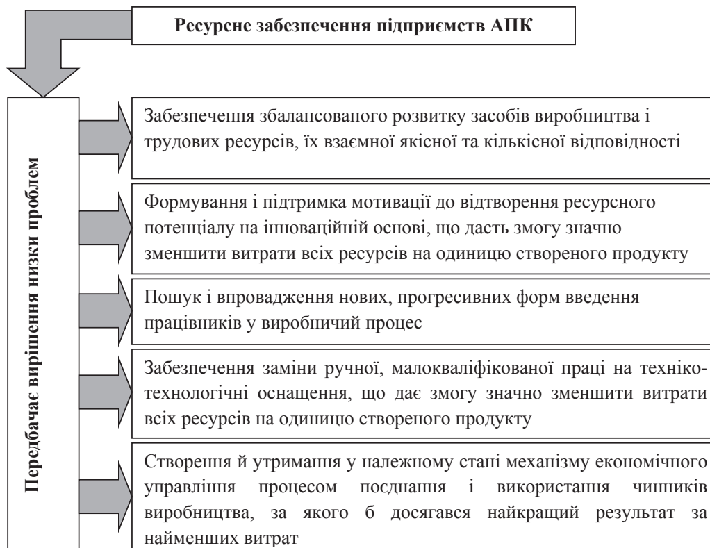
Рис. 3. Способи вирішення проблемних аспектів ресурсного забезпечення підприємств АПК