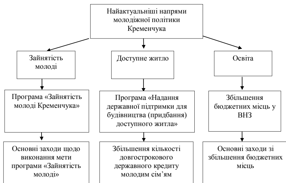
Рис. 2. Модель покращення молодіжної політики Кременчука

Змінився також порядок використання бюджетних коштів, передбачених для надання дер-