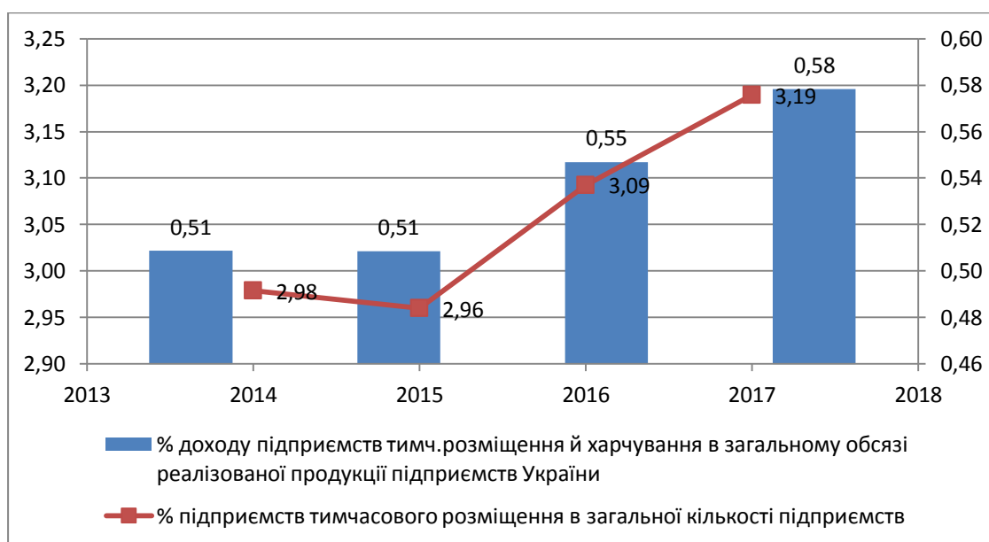
Рис. 1. Частка підприємств тимчасового розміщення в загальній кількості підприємств України та частка їх доходу в загальному обсязі реалізованої продукції [6]

На рис. 3 відображено структуру кількості туристів-громадян України та іноземців. Частка іноземних туристів має виражену тенденцію до збільшення. У 2014 році вона складала 0,7% загальної кількості туристів, у 2015 році