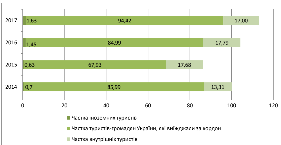
Рис. 3. Структура кількості туристів за 2014–2017 роки [6]

дещо зменшилась, а саме до 0,63%, у 2016 році збільшилась до 1,45%, а у 2017 році склала 1,63%.