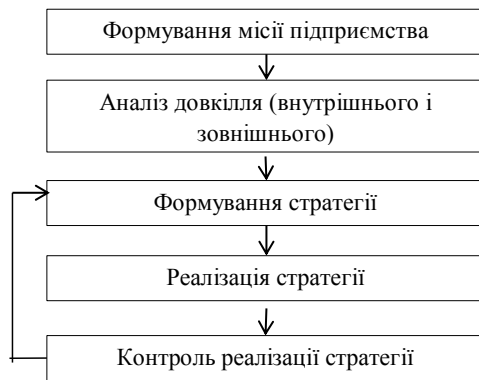
Рис. 3. Схема процесу стратегічного управління