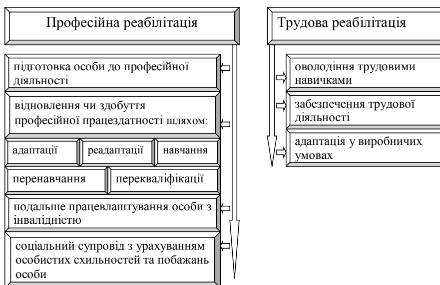
Рис. 1. Заходи професійної та трудової реабілітації

Закон України «Про зайнятість населення» від 5 липня 2012 року № 5067-VI [8] визначає правові, економічні та організаційні засади ре-