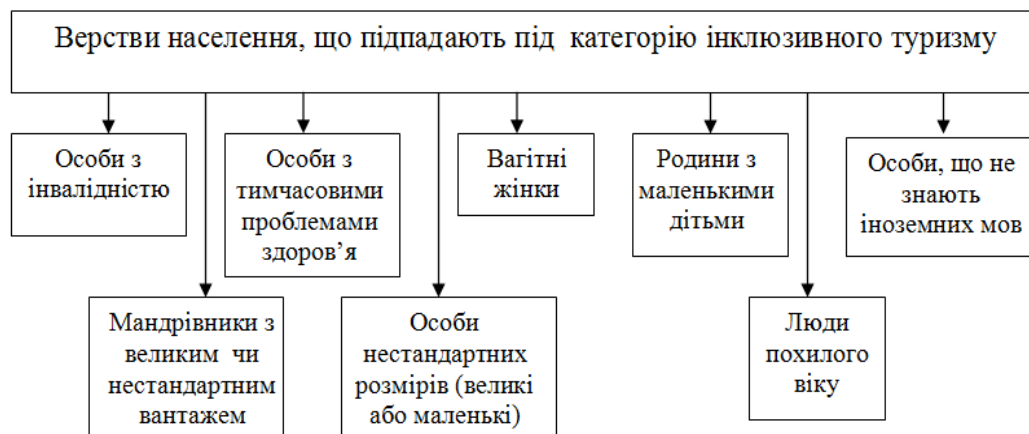
Рис. 1. Верстви населення, що підпадають під категорію інклюзивного туризму

Проблема полягає у відсутності спеціального обладнання, яке дає змогу людям з обмеженими можливостями пересуватися і вести повноцінний спосіб життя. І якщо в країнах ЄС давно