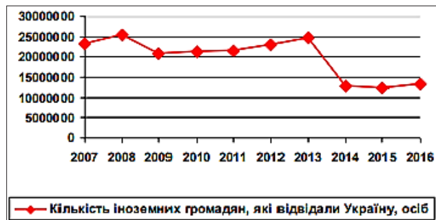
Рис. 1. Кількість іноземних громадян, які відвідали Україну, 2007-2016 рр.

адже за останні 10 років їх число зросло більш ніж у шість разів, указуючи на те, що наші громадяни надають перевагу іноземним курортам. Це пов'язано передусім з політичною кризою, економічною нестабільністю та тривалою анти-терористичною операцією.