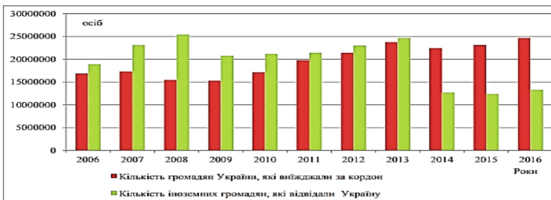
Рис. 2. Структура туристичного потоку України за 2006–2016 рр. в динаміці, осіб [4]

Подорожуючи, іноземні туристи вибирають різноманітні цілі, які Адміністрація Держприкордонслужби України поділяє на службову, ділову, дипломатичну, туризм, приватну, навчання, працевлаштування, імміграція, культурний та спортивний обмін, релігійну тощо [4; 5]. За даними Державного комітету статис-