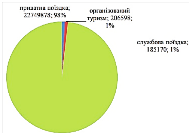
Рис. 3. Структура виїзного потоку громадян України в 2015 р., осіб [5]

тики, 92,7% виїзного туристичного потоку подорожує з приватною метою; 1,1% – з метою туризму та 5,8% – з культурною та спортивною, релігійною метою тощо (рис. 3) [4].