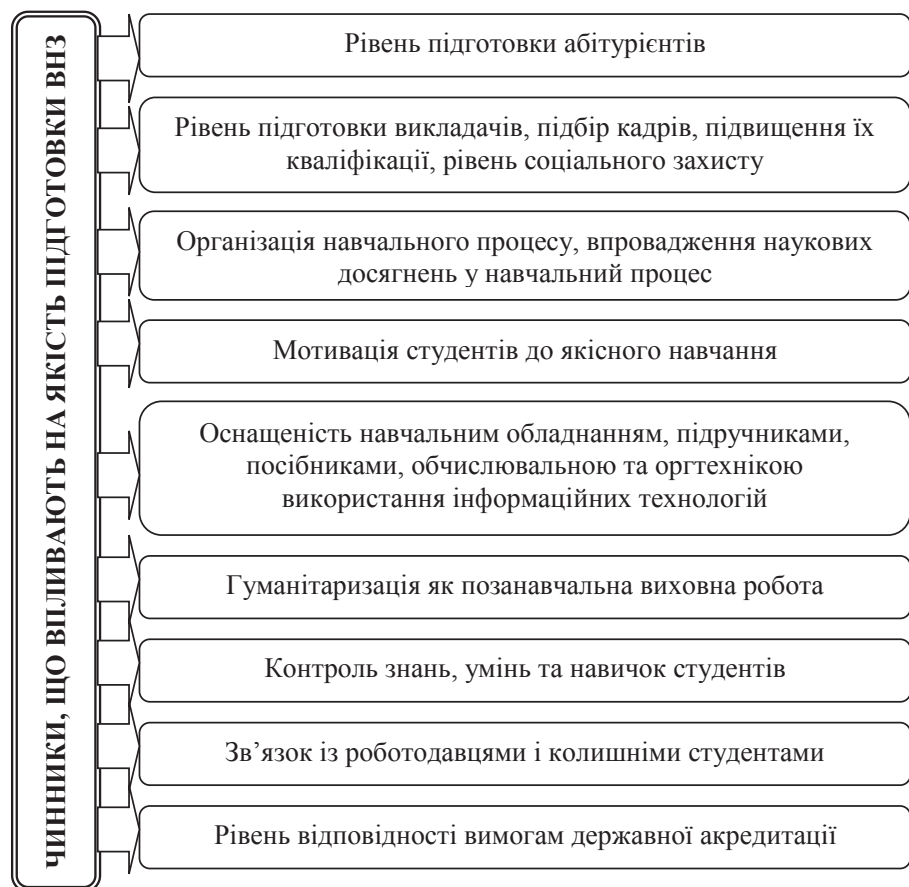
Рис. 1. Чинники впливу на якість підготовки кадрів ВНЗ

У контексті зазначеного варто відзначити, що які би політичні та економічні зміни не відбувалися у світі, але вища освіта продовжує відігравати важливу роль у становленні особистості. Тому кожна молода людина прагне вибрати найкращий вищий навчальний заклад, який би став щасливою путівкою в доросле життя. Але зробити це – не таке вже і просте