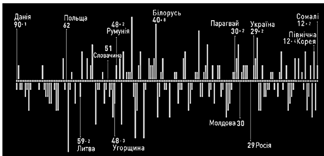
Рис. 2. Індекс сприйняття корупції в різних країнах світу

Дуже часто замість розроблення реального механізму взаємодії використовуються фор-