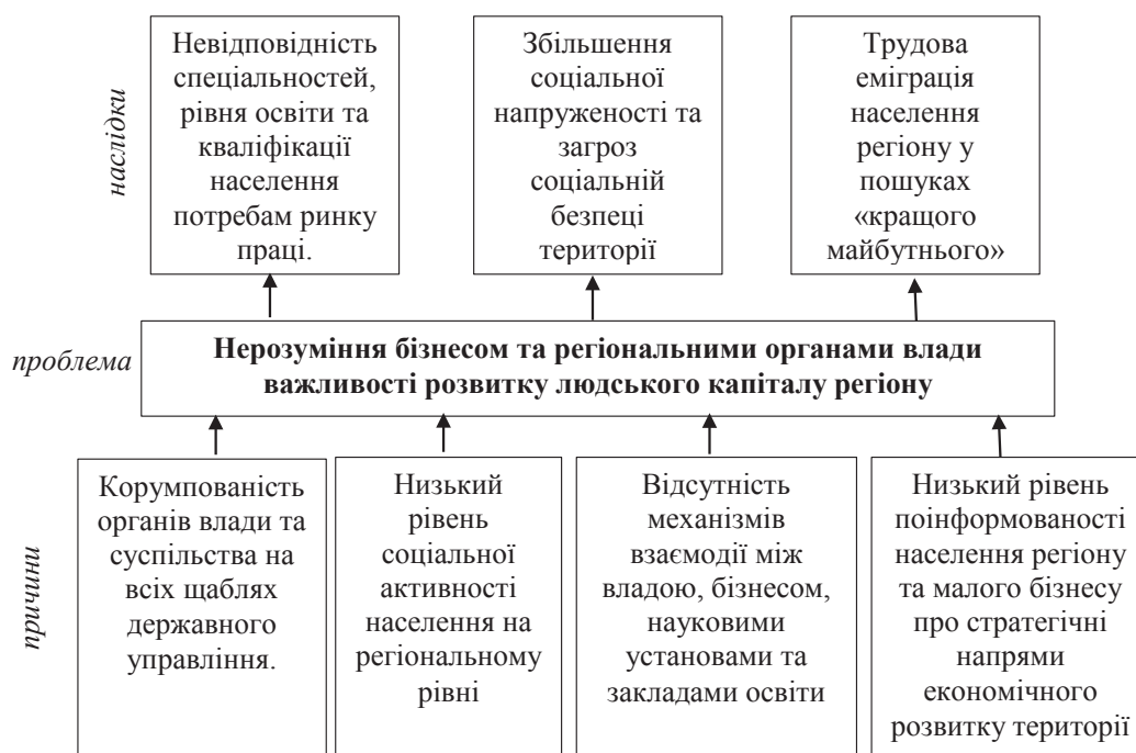
Рис. 1. Аналіз причин та наслідків головної проблеми впровадження соціального діалогу на регіональному рівні