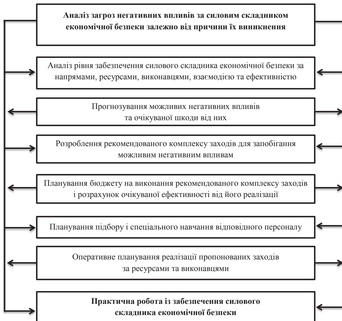
Рис. 2. Загальна принципова схема забезпечення силової складової економічної безпеки

2) негативні дії, спрямовані на те, щоб завдати шкоди майну, зокрема, загрози зменшення