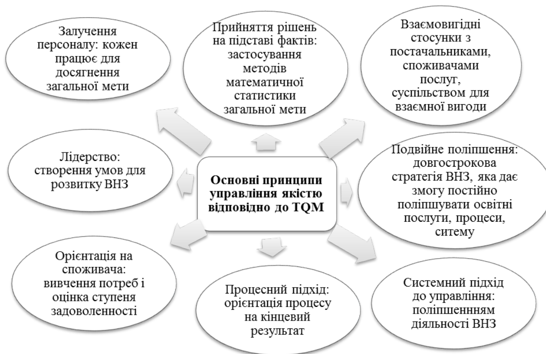
Рис. 2. Основні принципи управління якістю згідно з концепцією TQM