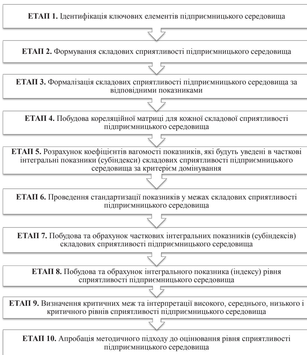
Рис. 1. Алгоритм реалізації методичного підходу до оцінювання рівня сприйнятливості підприємницького середовища

Розглядати сприйнятливості підприємницького середовища з позиції держави необхідно на основі визначення ефективності державної політики та дерегулювання, зокрема забезпечення стійкого економічного зростання, зниження рівнів інфляції