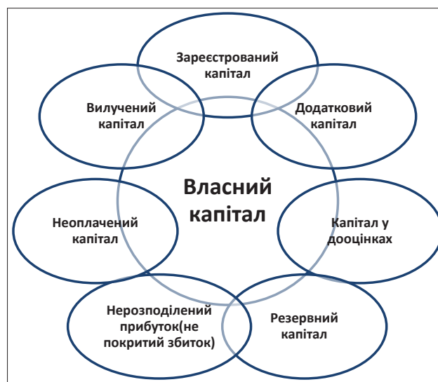
Рис. 1. Структура власного капіталу підприємства

вий капітал, резервний капітал, неоплачений капітал та вилучений капітал.