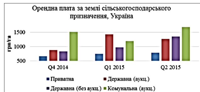
Рис. 1. Орендна плата за землі сільськогосподарського призначення, грн./га

тики передачі земель у користування виключно на відкритих земельних торгах. Для порівняння, орендна плата за землі держвласності, передані в користування на безконкурентних засадах за договорами минулих періодів, – усього 940 грн./га.