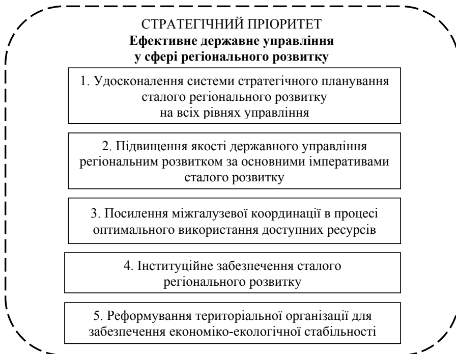
Рис. 2. Стратегічні напрями реалізації імперативів системи сталого розвитку у контексті досягнення стратегічного пріоритету Державної стратегії регіонального розвитку на період до 2020 року

Можна виділити такі основні інституціональні ознаки кластера: інтеграція різних форм і суб'єктів господарювання (органи муніципального управління, науково-дослідні, освітні, інші інституції, громадські організації, бізнес-структури