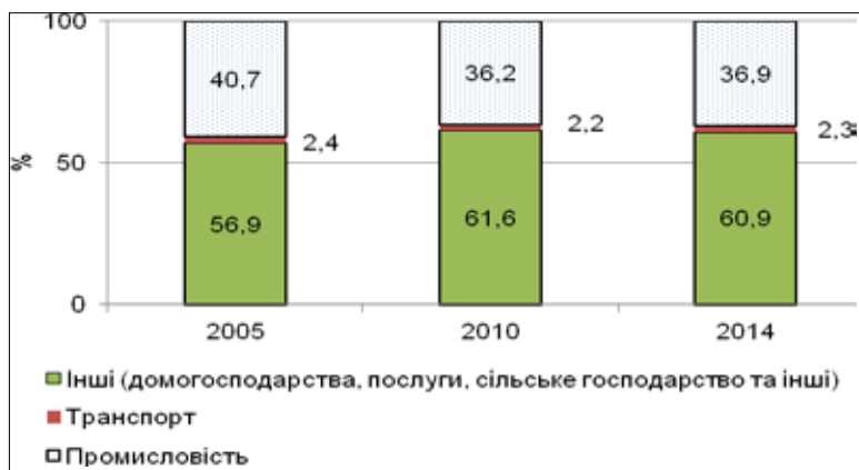
Рис. 1. Структура споживання електроенергії за секторами економіки в ЄС-28, %

При цьому відбувається скорочення питомої частки промисловості у спожи-